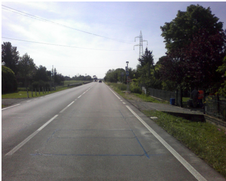
Postazione E Sala Bolognese