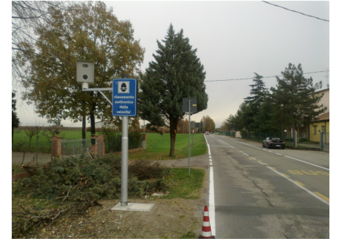
Postazione D Calderara di Reno