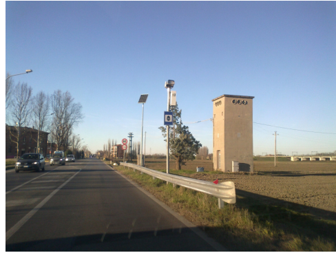
Postazione B Anzola dell'Emilia