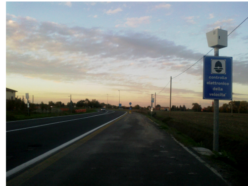
Postazione G Sala Bolognese