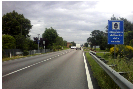
Postazione F Sala Bolognese