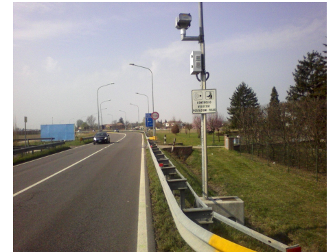
Postazione H San Giovanni in Persiceto