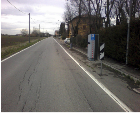
Postazione A Anzola dell'Emilia