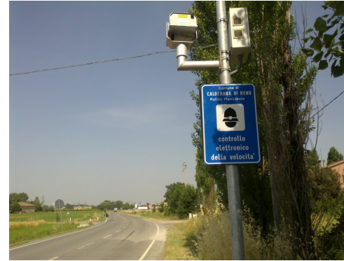
Postazione C Calderara di Reno